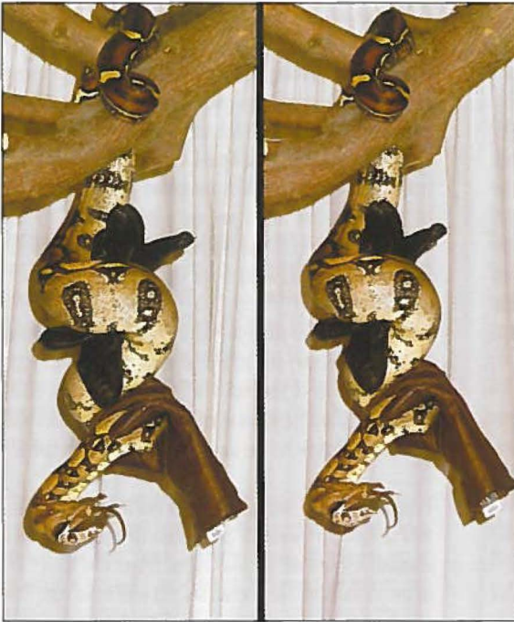
Foto 2B: 3D opnames van een Boa constrictor hangend aan een tak met twee handschoenen in de wurggreep en een prooi in de bek. Zie tekst voor uitleg over het bekijken. Photo 2B: 3D pictures of a Boa constrictor hanging from a branch with two gloves constricted and a prey in the mouth. See text for explanation on the viewing.