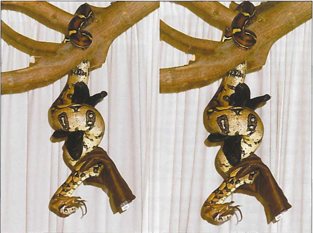
Foto 2A: 3D opnames van een Boa constrictor hangend aan een tak met twee handschoenen in de wurggreep en een prooi in de bek.

adult female on the wooden platform of a stepladder that I put in our sitting room. The young are placed on hawthorn branches, which I suspended from the ceiling (cf. Verveen for details). I am, hence, able to easily observe the feeding behaviour of my boas.