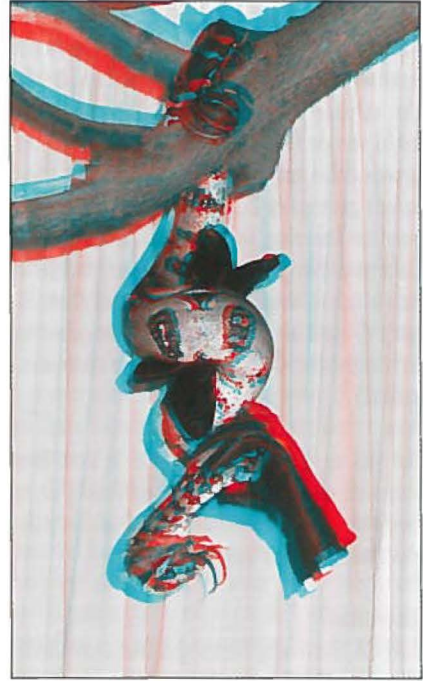
Foto 2C: 3D opnames van een Boa constrictor hangend aan een tak met twee handschoenen in de wurggreep en een prooi in de bek. Zie tekst voor uitleg over het bekijken. Photo 2C: 3D pictures of a Boa constrictor hanging from a branch with two gloves constricted and a prey in the mouth. See text for explanation on the viewing.

al loopt het bij de kop wat mis, omdat de boa ondertussen met de maaltijd verder was gegaan. Verder hangt door de verschillen in flietsrichting ook de schaduw op de gordijnen in de ruimte.